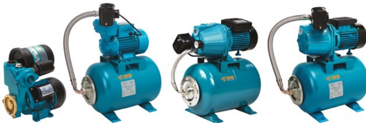
POMPA WZCH 250 Z WBUDOWANYM OSPRZĘTEM HYDROFOROWYM