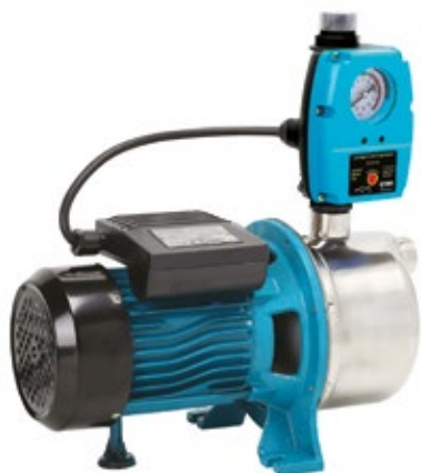
POMPA AJ 50/60 Z AUTOMATEM PC-59