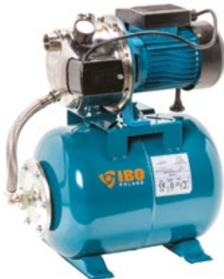
POMPA AJ 50/60 Z OSPRZĘTEM + ZBIORNIK 24 C.W.