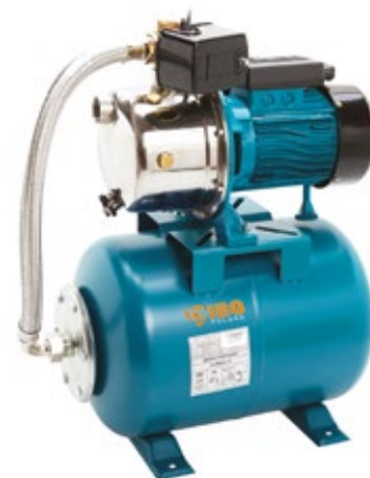
POMPA AJ 50/60 Z OSPRZĘTEM + ZBIORNIK 24

Zestaw hydroforowy to sprawdzone rozwiązanie automatycznego zasilania w wodę gospodarstw domowych. Każda z pomp powierzchniowych marki IBO może być skompletowana w dowolny zestaw hydroforowy. Wielkość zbiornika jest dobierana pod indywidualne potrzeby klienta. Oprócz klasycznych zestawów pompa + zbiornik możliwa jest konfiguracja pompy z automatami hydroforowymi z serii: PC (PC-10P/ PC-13 / PC-15 / PC-16 / PC-59), SK (SK15) oraz przemiennikami częstotliwości IVR-05. Automaty posiadają dodatkowe zabezpieczenie przed suchobiegiem. Zestaw działa całkowicie automatycznie, przy odkręceniu wody uruchamia pompę, a po zakręceniu wyłącza.