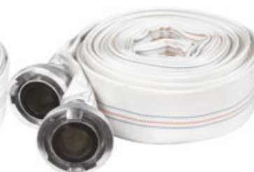
Wąż parciany z szybkozłączkami