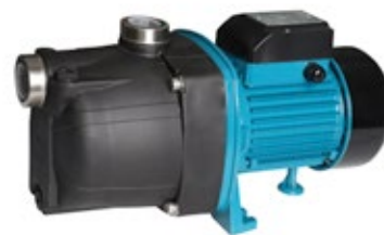
JSW 150 GARDEN

Jednostopniowa, samossąca, odśrodkowa pompa powierzchniowa, wyposażona w układ podnoszący zdolność zasysania, dzięki zastosowaniu tuby Venturiego. Przeznaczona do pompowania czystej, zimnej wody z własnych ujęć oraz podnoszenia ciśnienia. Pompy znajdują zastosowanie przy zaopatrywaniu w wodę domów, działek rekreacyjnych oraz przy nawodnieniach.